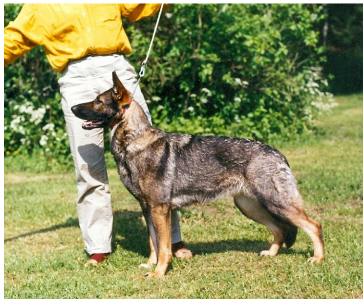
Arina var fallen e.KORAD S B CH Wulcanos Garone u.KORAD Silverpilens Össi

Arina föddes 1990, här är hon ca 8 månader gammal.