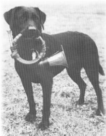
ALLEZ EVELINA (S J Ch Twigg Tufted Duck – Alltid Sun Flower)

S J CH Allez Evelina efter sin 1 ekl HP och Bästa Hund på Claestorp 1979