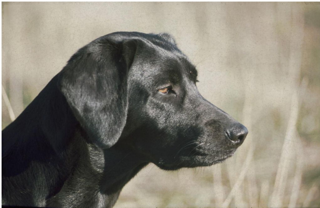
Di 4 år gammal

aveln om den visat sig nedärva något oönskat. Självklart har vi gjort misstag under åren men jag vill påstå att vi tagit lärdom av dem och blivit klokare och visare. Den röda tråden har vi försökt hålla oss så nära som möjligt och den linje av kennel Twigg's som i dag lever vidare har, i rakt nedstigande moderslinje, i sju generationer, S J CH Nattens Black Diamond som stamtik.